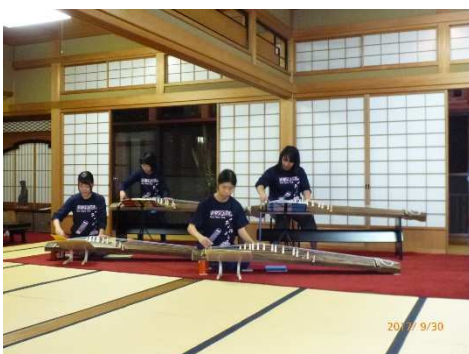
名古屋経営短期大学部 箏曲部の演奏