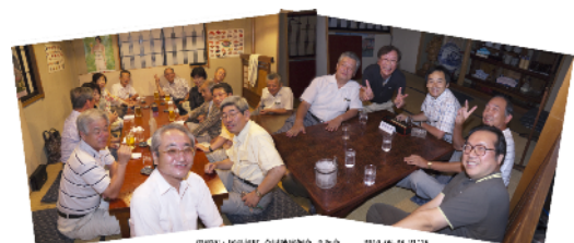
二次会会場(伊那RC・尾張旭RC会員)