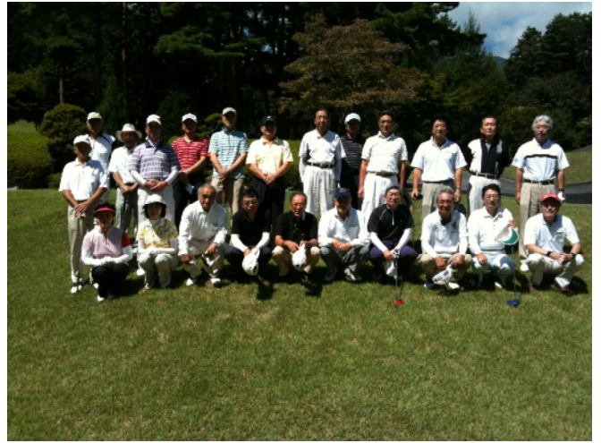
伊那RC・尾張旭RC参加者

日時 平成22年8月29日(日) 10:22スタート 場所 高森カントリークラブ