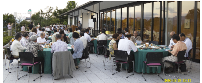
かんてんぱぱで、例会を行いました。