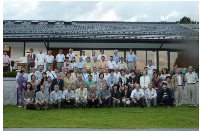
伊那RC・尾張旭RC・伊那RAC参加者全員で!

日時 平成22年8月28日(土) 18:00~ 場所 伊那市 かんてんぱぱ「(株)伊那食品」