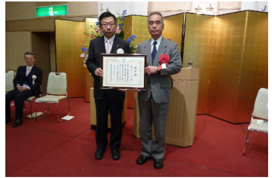
尾張旭市へテーマ塔贈呈と市より感謝状をいただきました。