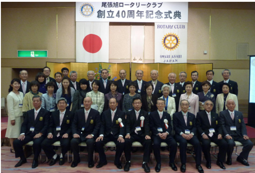
会員・家族で記念写真