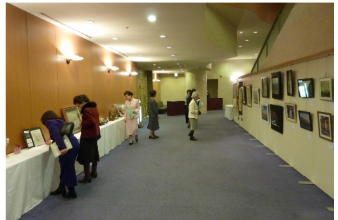
ロビーに会員・家族の力作が展示されました。