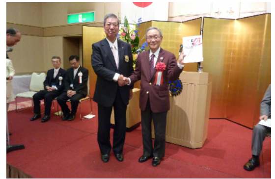
安藤ロータリー基金委員長からガバナーへ目録贈呈。