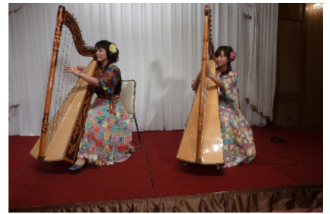
アトラクション アルパ(ラテンハープ)演奏