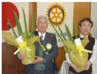
今月の結婚記念日