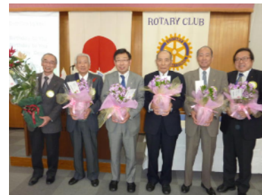
今月の誕生日祝福