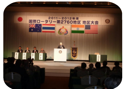
松前 憲典 ガバナーの あいさつ