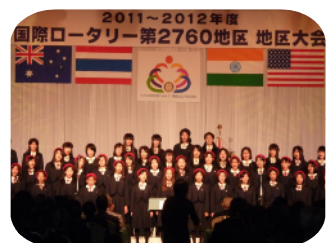
聖霊中・高校生聖歌隊