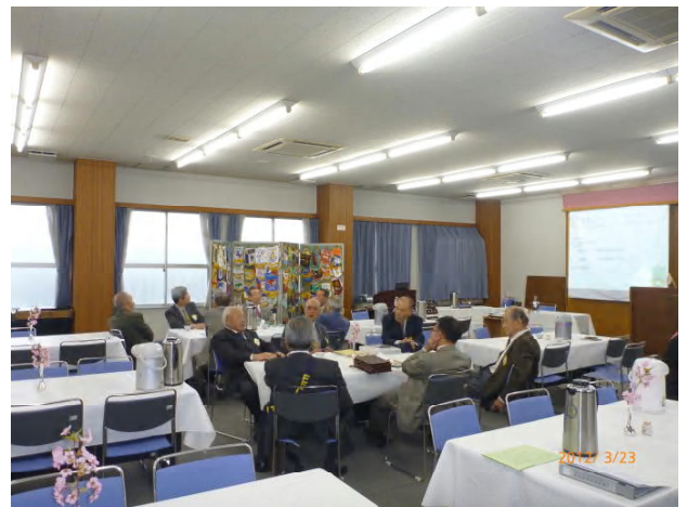
△ 本日のフォーラムです。