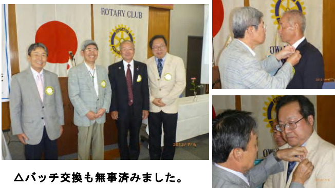
△バッチ交換も無事済みしました。