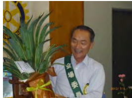
△ 今月の祝福の皆さん