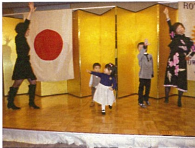
△じゃんけん最後の生き残りチーム