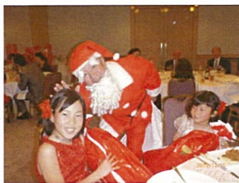
△サンタがやってきた。