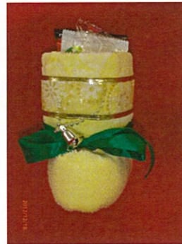
お菓子がいっぱい入っていました。

名古屋経営短期大学の学生さんが、尾張旭市の健康タオルでサンタの靴を作り、9月に訪問した(学生・ロータリアン)被災地 松島市第二幼稚園へプレゼントされました。