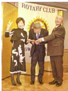
△みごと勝ち抜いたカップルは