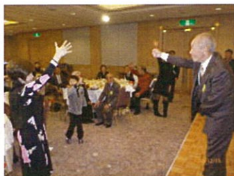
△じゃんけんゲーム