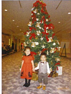
△クリスマスツリーの前で