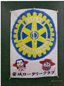
△和風を頂きました