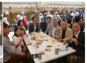
△ロータリーテントです。