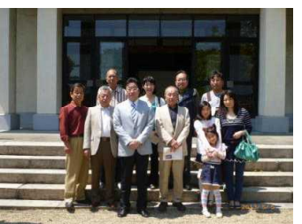
△参加者で記念に！ 天理教名古屋大教会前にて