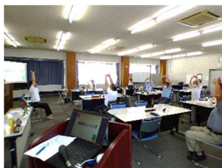
生涯現役を目指して、健康トレーニングを開催